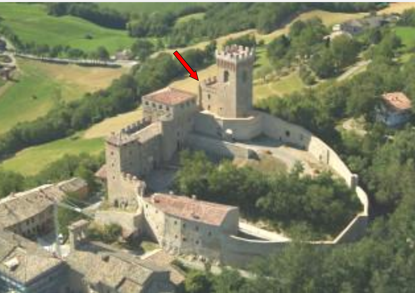
Castello di Montecuccolo - Pavullo Nel Frignano (Mo)