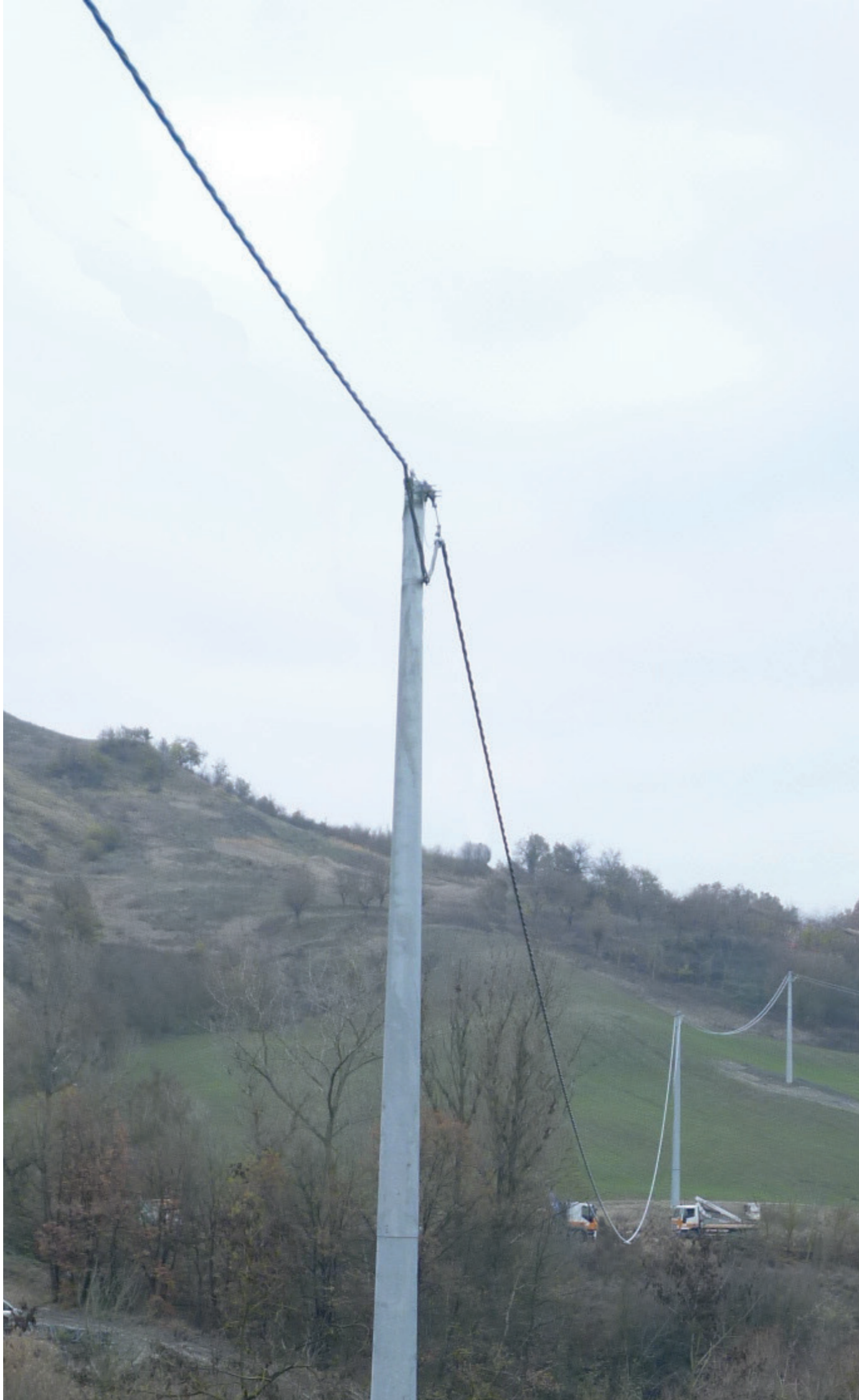
particolare della linea in progetto