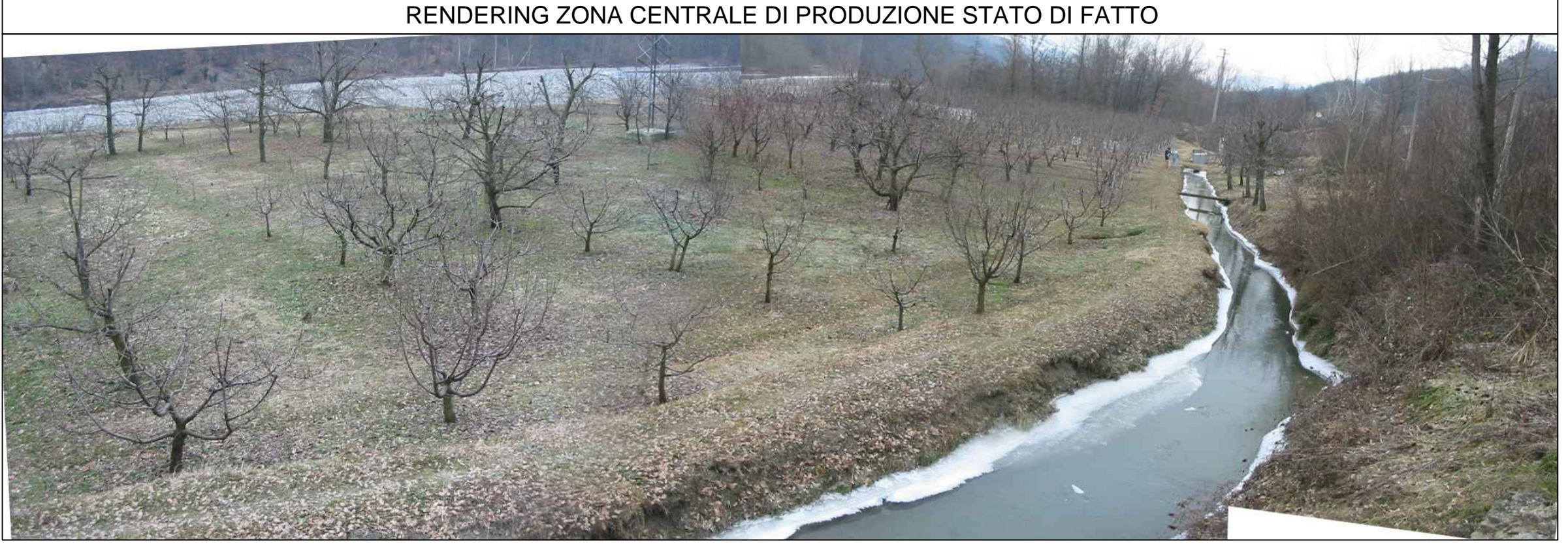
Tavola 7.1 Centrale di produzione: - Vista e sezione planimetriche - Sezioni trasversali - Rendering fotografico Scala 1:200

Provincia di Modena Comune di Pavullo nel Frignano INTEGRAZIONI ALLO STUDIO D'IMPATTO AMBIENTALE IMPIANTO IDROELETTRICO DENOMINATO "MOLINO DELLE PALETTE" Sul fiume Panaro COMMITTENTE: MOLINO DELLE PALETTE S.r.l. Via C. Battisti 6- 25079 Vobarno (BS) Tel. 0365- 528013