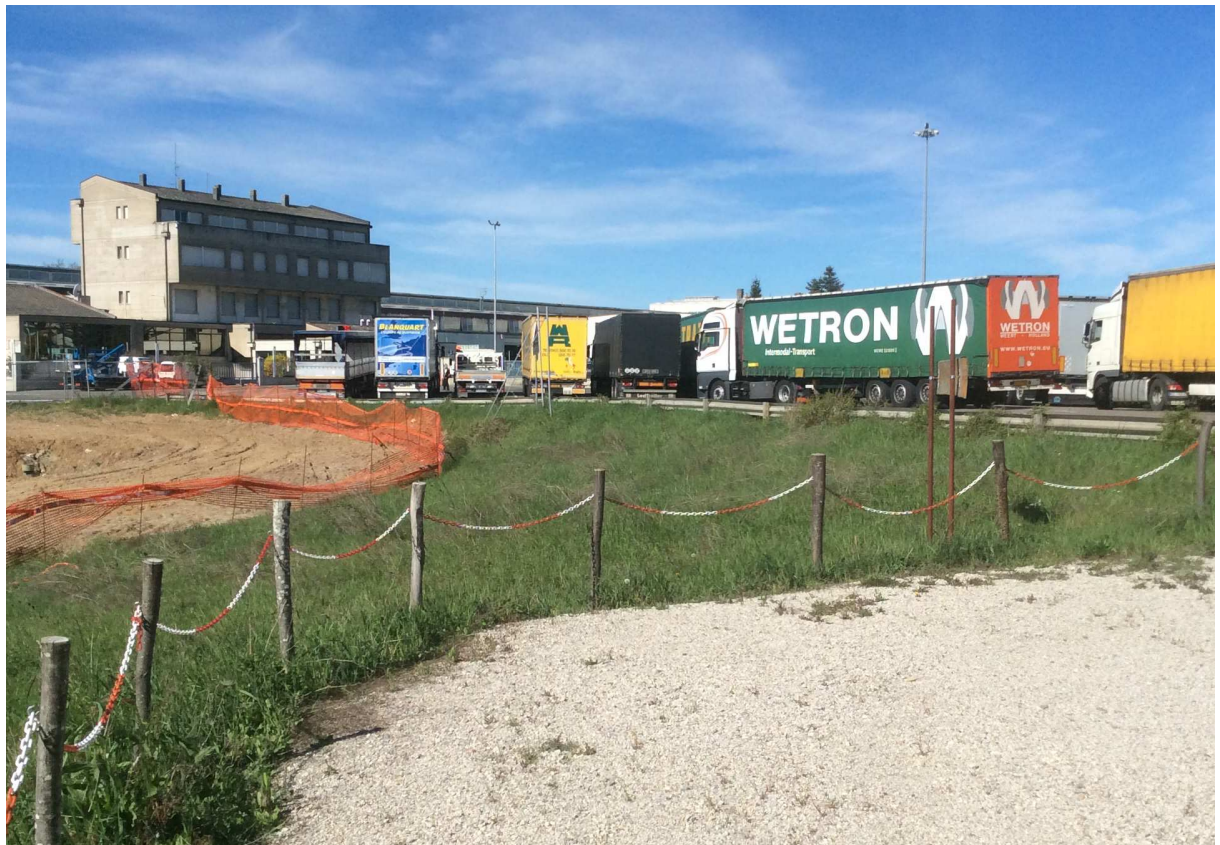
Foto 5a e 5b – Attuale palazzina ingresso su via Bottegone e parcheggio camion