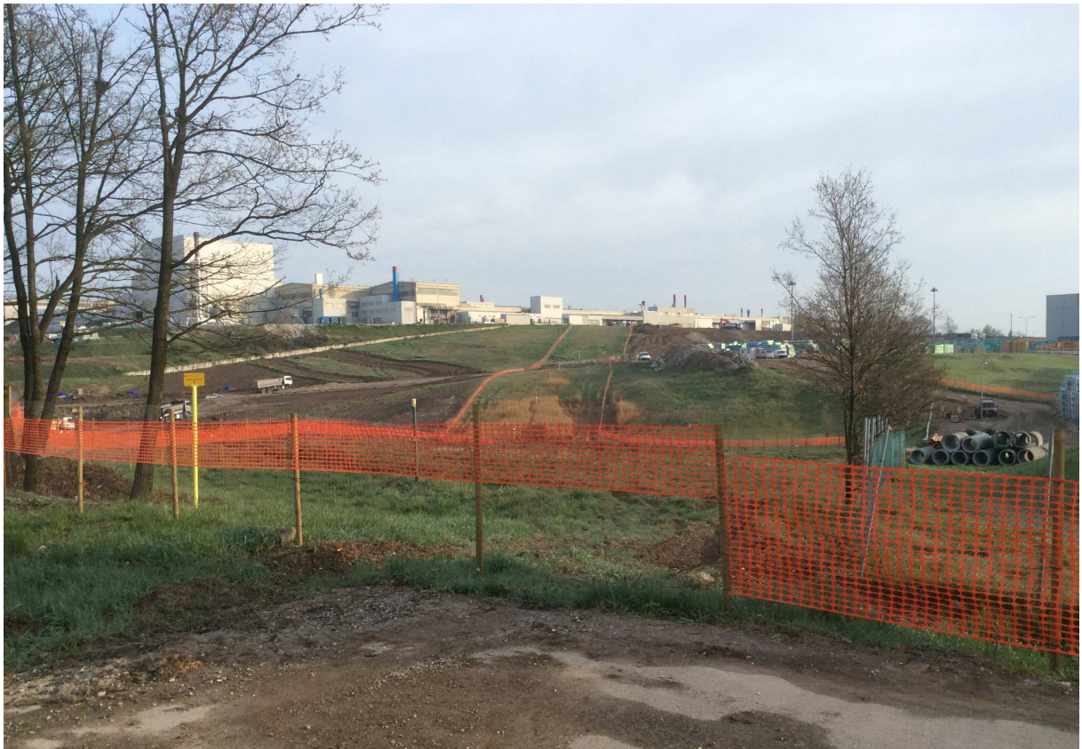
Foto 4 - Vista d'insieme dello stabilimento e dei sottoservizi da rimuovere