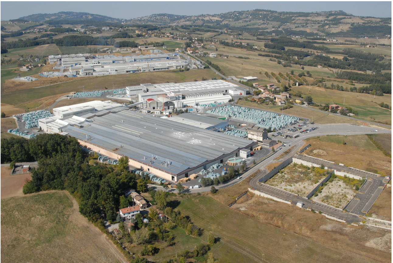
Foto 1 – Vista aerea dello stabilimento e dell'ex PP "la Chiozza"