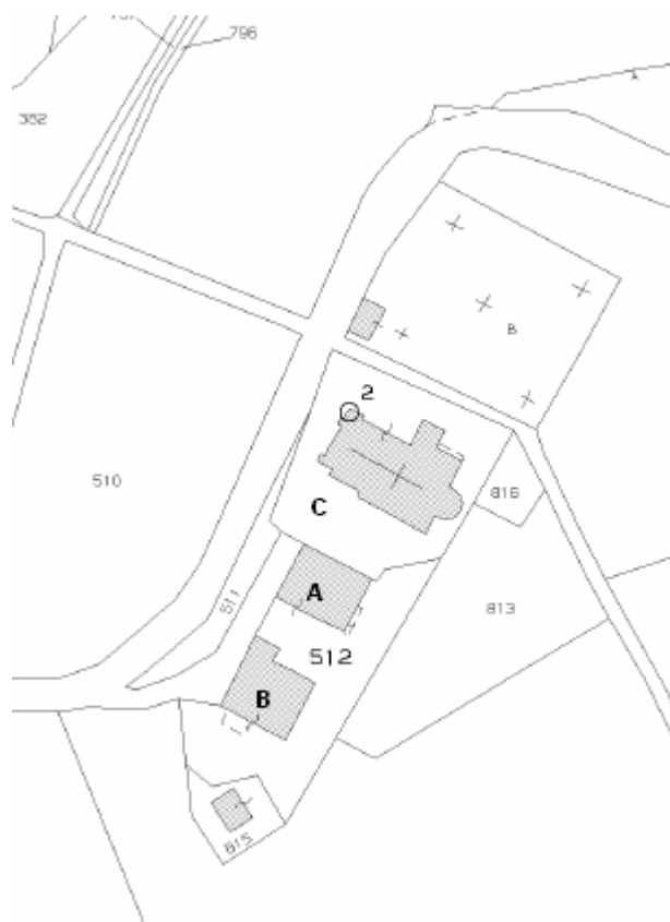
Stralcio di mappa catastale