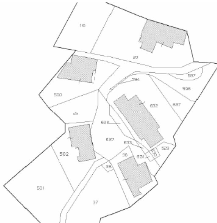
Stralcio di mappa catastale