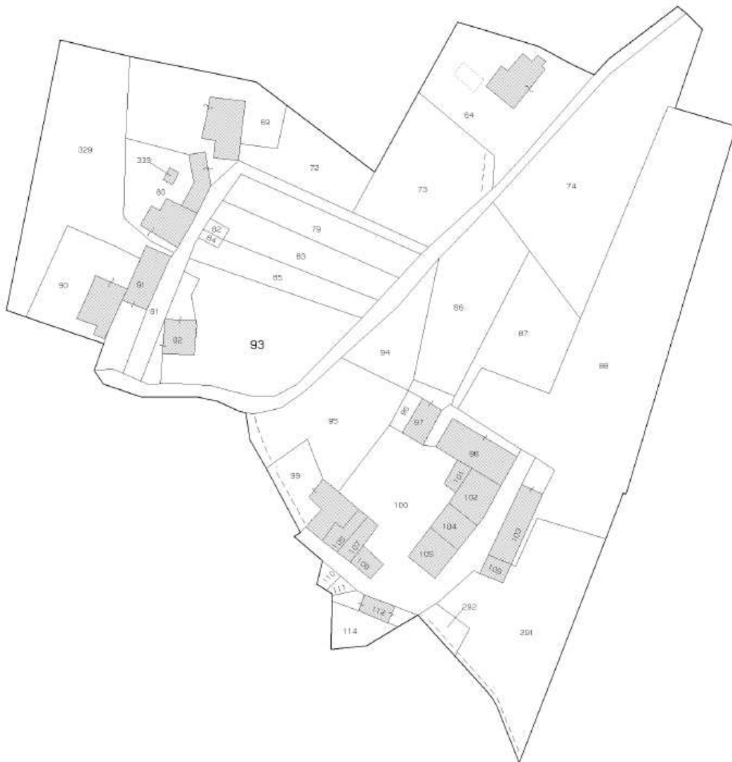
Stralcio di mappa catastale