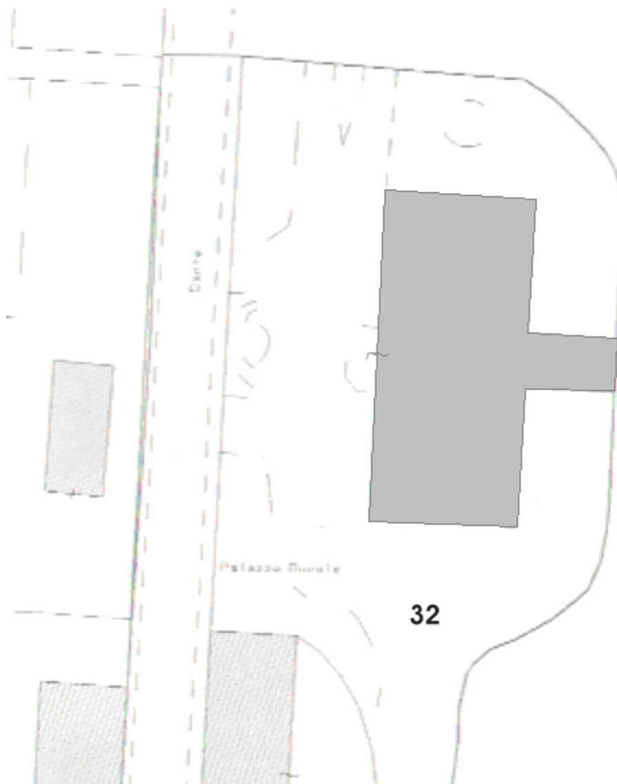
Stralcio di mappa catastale