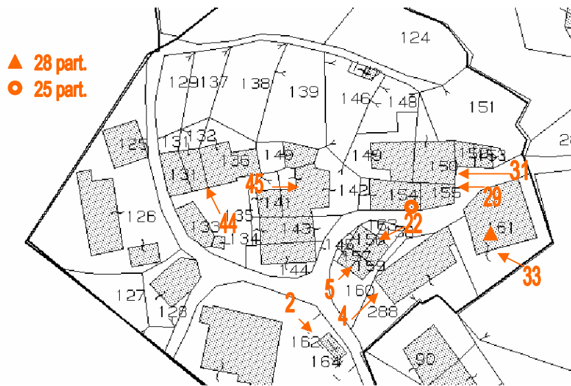
Punti di ripresa fotografica