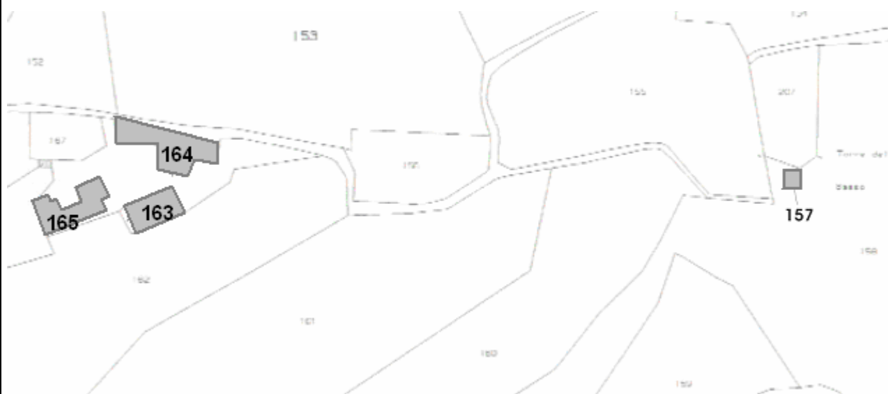
Stralcio di mappa catastale