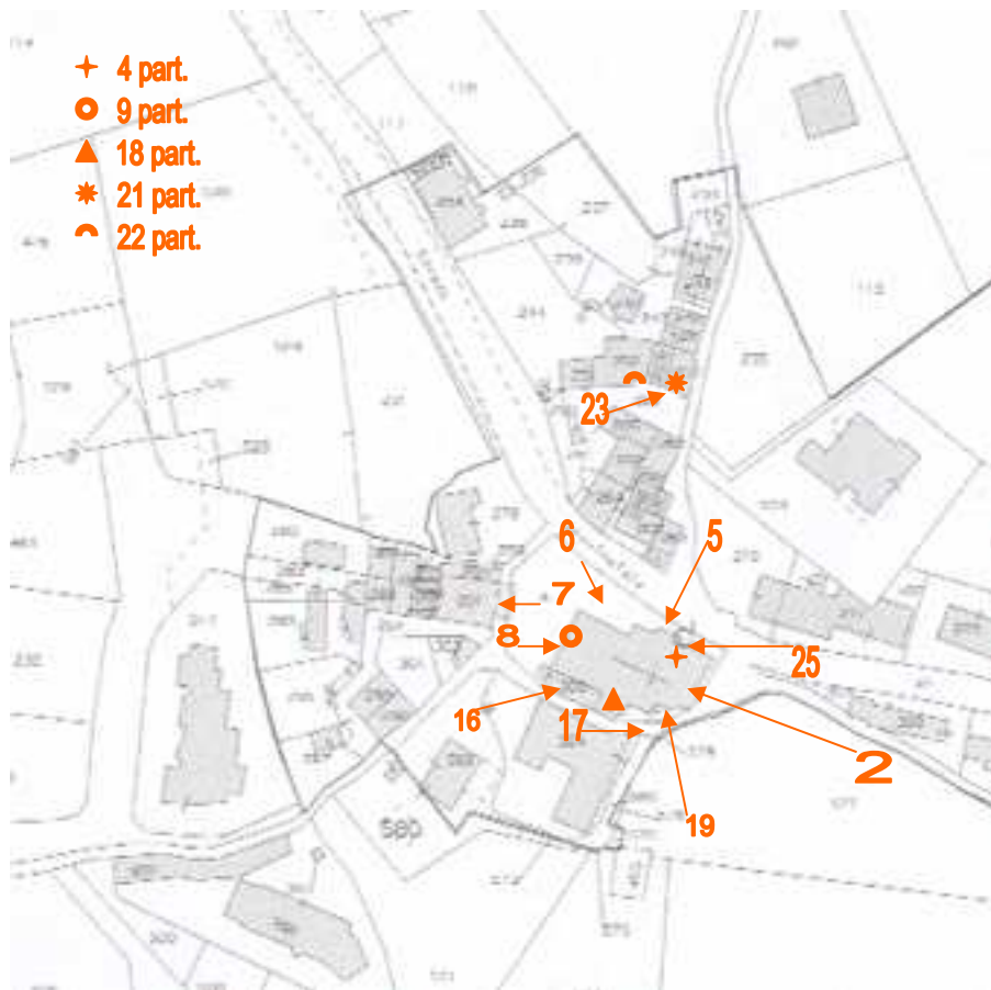
Punti di ripresa fotografica