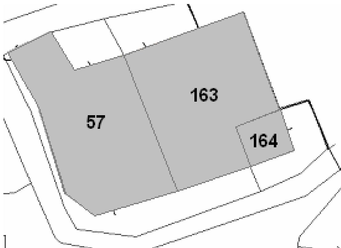
Stralcio di mappa catastale