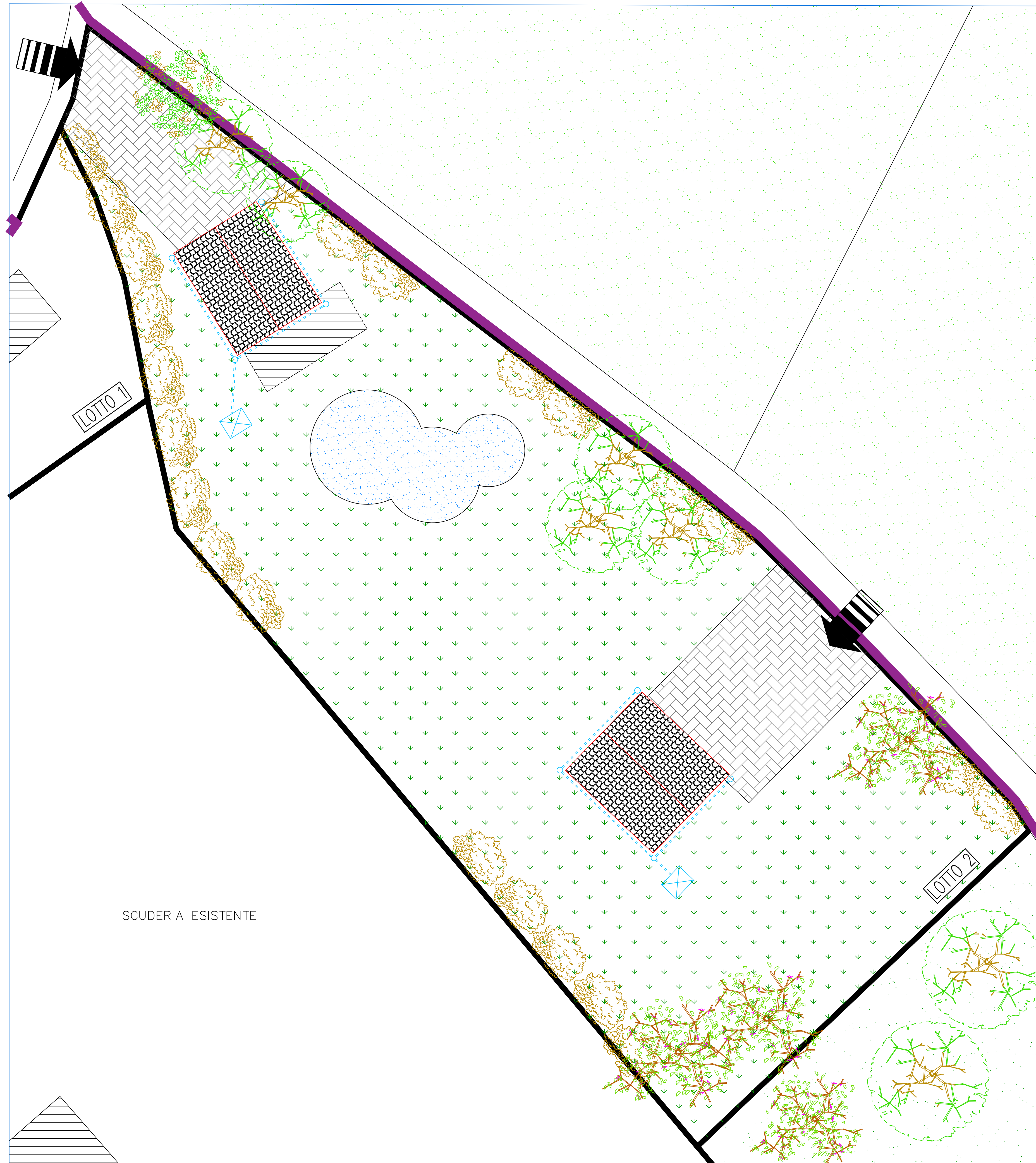
PLANIMETRIA GENERALE "LOTTO 2" SCALA 1:200