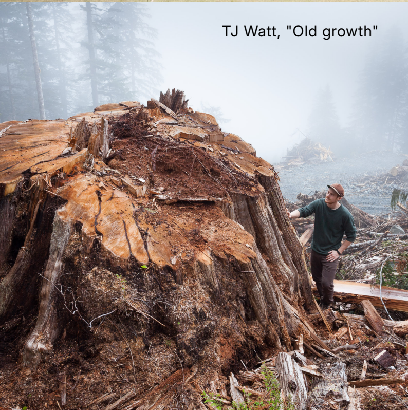
TJ Watt, "Old growth"